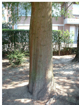
, 04 August 2003