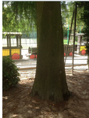
, 02 September 2013

XLSX (Excel 2007) - XLS (Excel 1997-2003) .