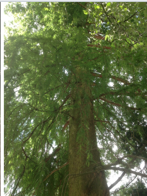
, 02 September 2013