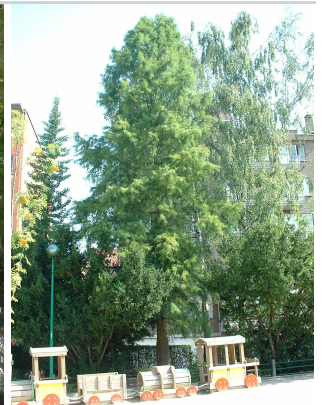
, 04 August 2003